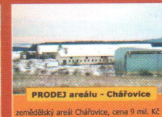
PRODEJ areálu - Cháfovice zemědělský areál Cháfovice, cena 9 mil. Kč