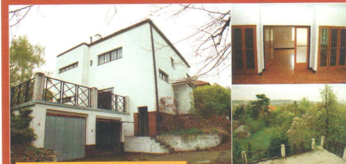
PRODEJ vily 9+1+2xgar., PS, krásný výhled na Prahu

Přvopubliková vila, Praha 5 - Košíře, částečně po rekonstrukci, velká zahrada se vzrostlými stromy, velká terasa, klidné prostředí, velmi dobrá dostupnost (bus z Anděla). Blíží informace a plány jsou k dispozici v naší kanceláři.