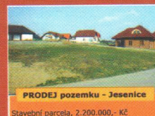
PRODEJ pozemku - Jesenice Stavební parcela, 2.200.000,- Kč